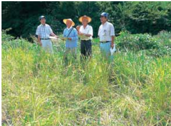
▲現地損害評価の様子

東濃農林事務所 恵那農林事務所 東美濃農協中津川アグリセンター 東美濃農協恵那アグリセンター 東美濃農協南アグリセンター 東美濃農協恵那北アグリセンター 陶都信用農協経済部 東美濃農協本店 岐阜県農業共済組合連合会